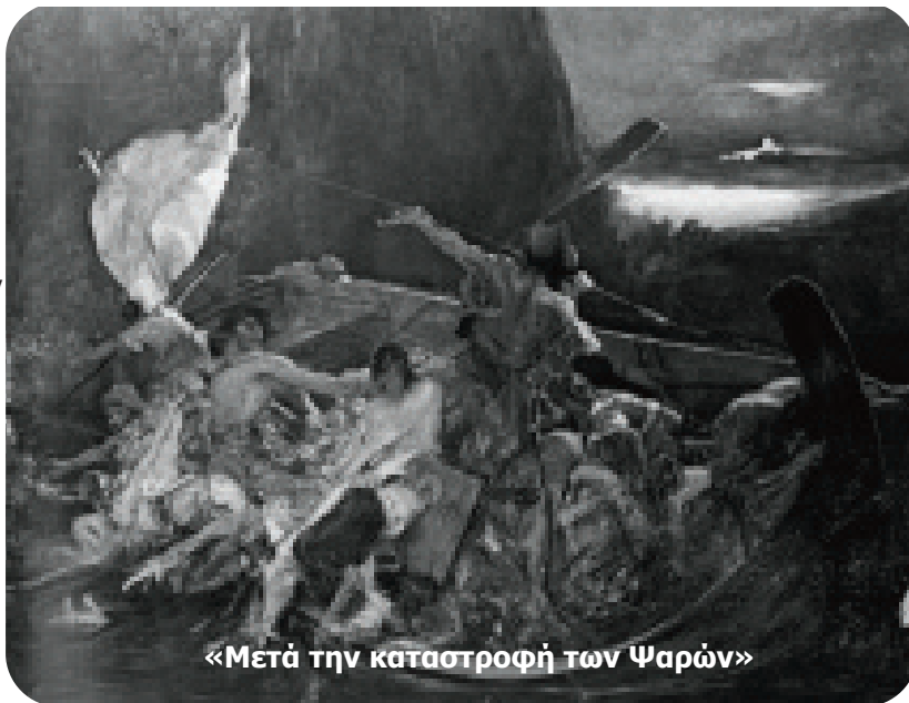
«Μετά την καταστροφή των Ψαρών»

Δειγματα απο τις δουλειες των παιδιων μπορείτε να δειτε στην σηλη "...και απο παιδι μαθαίνεις την αλήθεια"