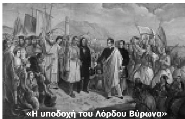
«Η υποδοχή του Λόρδου Βύρωνα»

Το σχέδιο είναι βασισμένο στο Διαθεματικό Αναλυτικό Πρόγραμμα Σπουδών του Παιδαγωγικού Ινστιτούτου, στο project zero of Harvard University (Artful Thinking) και στο πρόγραμμα του Υπουρ-